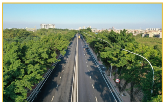
▲10月27日，集团承建的中山市北部县道X572沙港路大修二期工程建成通车。