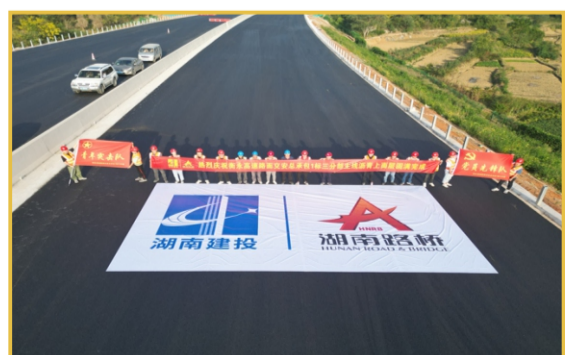
▲10月28日，衡水高速路面交安总承包1标一、二、三分部主线沥青上面层施工任务完美收官。