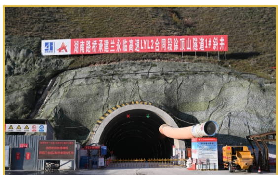
▲10月30日，甘肃兰永临高速2标徐顶山隧道1#斜井顺利贯通，比原计划提前30天。