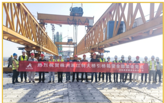
▲10月16日，株洲湘江特大桥引桥预制箱梁全部架设完成。