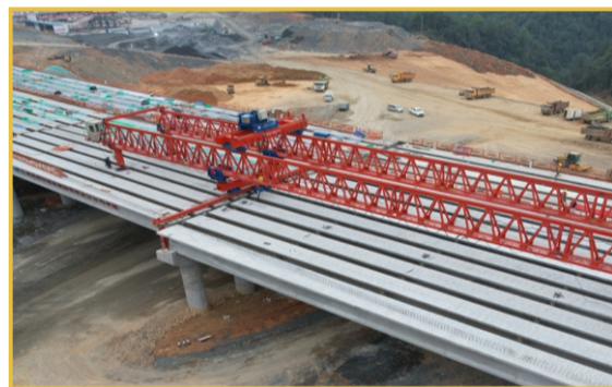
▲10月8日，城龙高速第二合同段泮水互通主线桥实现双幅贯通。