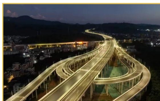
▲10月28日，集团承建的从埔高速一期工程顺利建成通车。