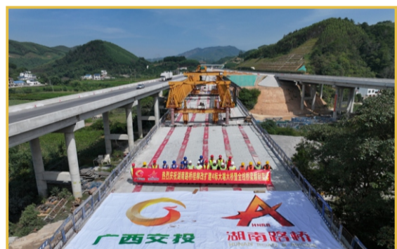
▲10月18日，桂柳改扩建4标全线路架梁架设圆满完成。