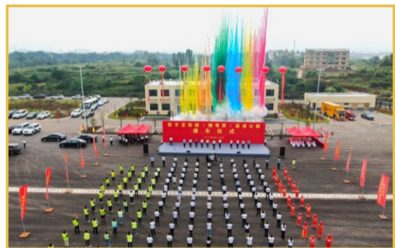
▲在中秋、国庆节到来之际，集团承建的江西信丰至广东南雄（赣粤界）高速公路建成通车，项目提前两个月实现竣工通车，成为江西今年唯一新建通车的高速公路项目。