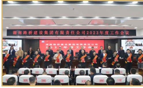
现场表彰年度优秀青年。