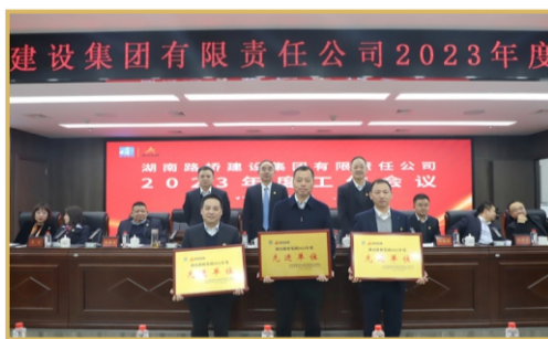
现场表彰年度先进单位。