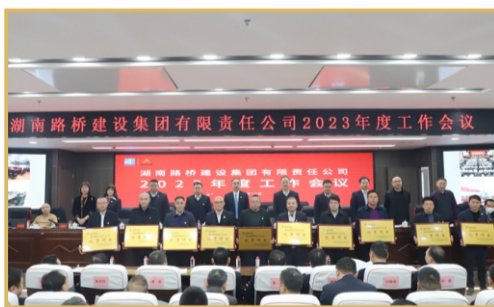
现场表彰年度先进项目。