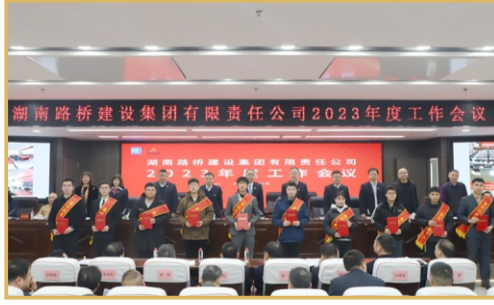
现场表彰年度优秀新员工。