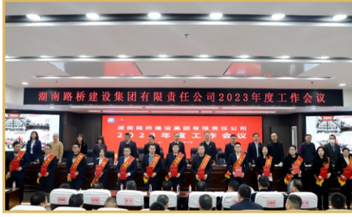
现场表彰年度先进工作者。